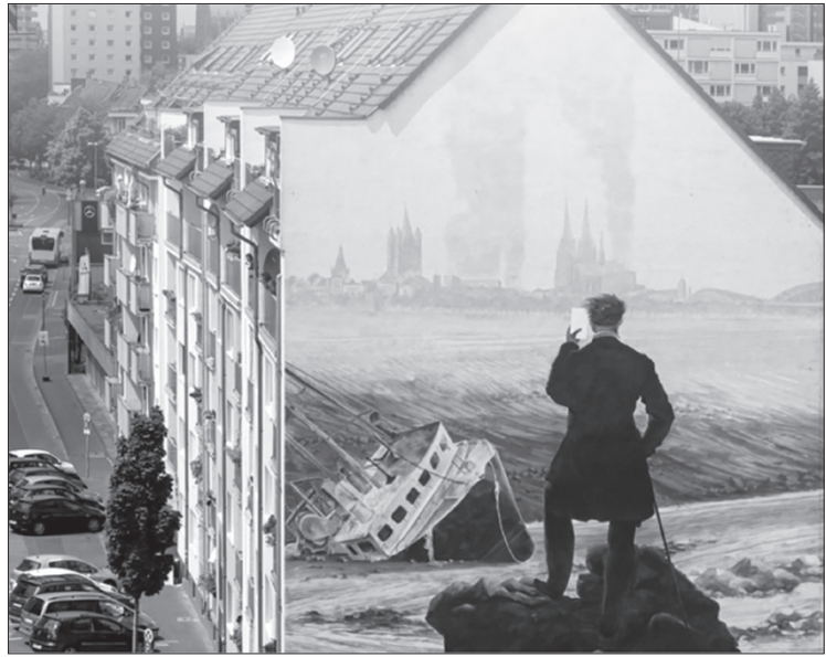
Modernes Wandbild in Köln (2019): ein Kommentar zur Umweltkrise

Sources (from left): < https://commons.wikimedia.org >; Innerfields art collective, Walls of Vision, < https://www.wallsofvision.de >