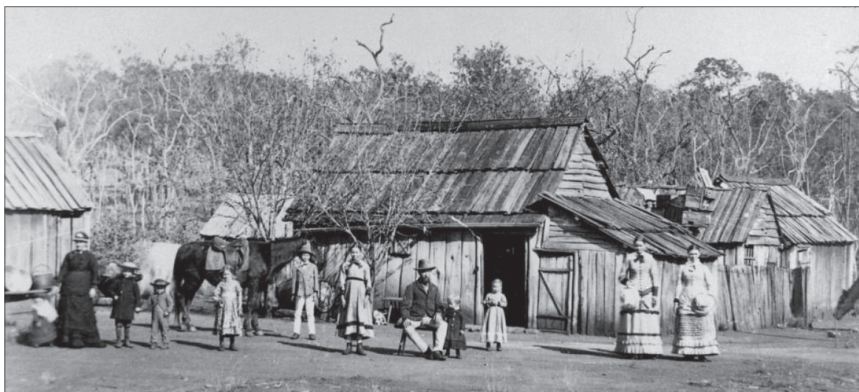
First residential hut of a German settler

Stellen Sie sich vor, dass Sie und Ihre Familie im Jahr 1845 aus Deutschland ausgewandert sind und jetzt in einer kleinen deutschen Siedlung in Australien leben, ähnlich wie die auf dem Bild unten. Schreiben Sie eine Geschichte über ein Abenteuer oder Ereignis, in das Sie oder ein Mitglied Ihrer Familie verwickelt waren. Ihre Geschichte wird in einem Sammelband mit Erzählungen für junge Erwachsene veröffentlicht.