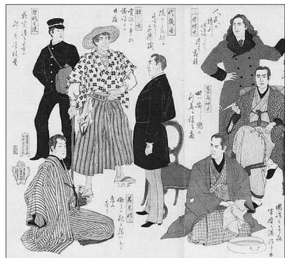
Source: Mizuno Toshikata, Men of Enlightenment , < https://rekisi-omosiroi.com/meizizidai-fukusou/ >